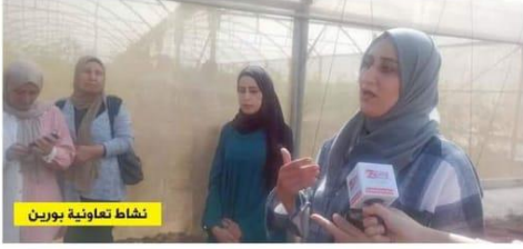
نشاط تعاونية بورين