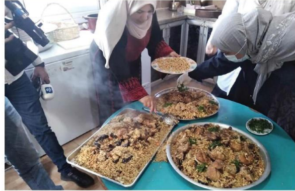
تخصص 5% من إيراداتها السنوية لمسؤوليتها الاجتماعية