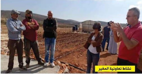
نشاط تعاونية المغير

رام الله- الحياة الاقتصادية- ابراهيم ابو كاش- أظهرت الزيارات الصحفية الميدانية التي نظمتها جمعية المرأة العاملة الفلسطينية للتنمية، بالشراكة مع مؤسسة «وي إيفيكت» WE EFFECT السويدية لمدة يومين، قصص النجاح التي سجلها عدد من التعاونيات الزراعية النسائية والشبابية في «بيتفور، الشيوخ، المغير،