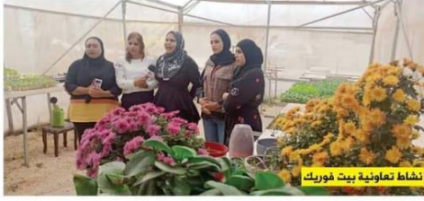
نشاط تعاونية بيت فوريك